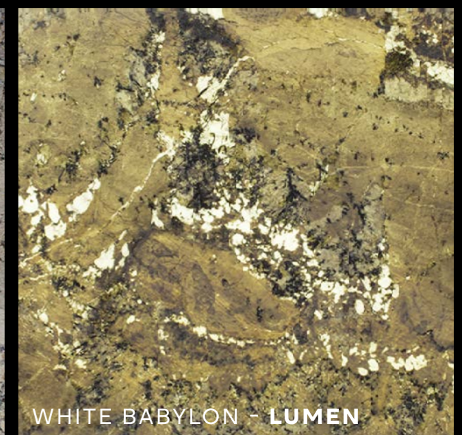
WHITE BABYLON - LUMEN