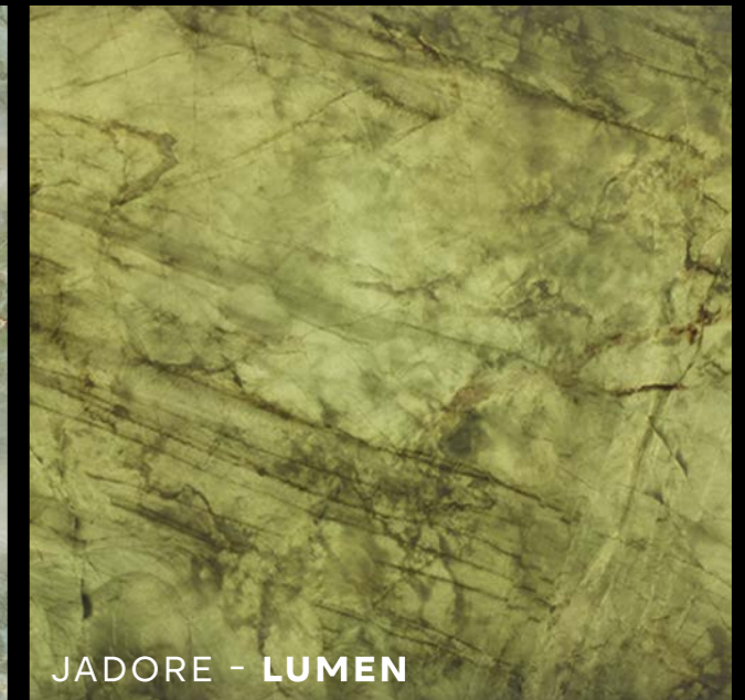
JADORE - LUMEN