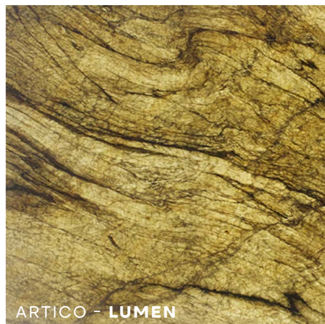
ARTICO - LUMEN

Sistema integrato di retroilluminazione Soluzione pensata per esaltare la matericità attraverso la luce, trasformando la superficie in un elemento architettonico luminoso, scenografico e ad alto impatto visivo.