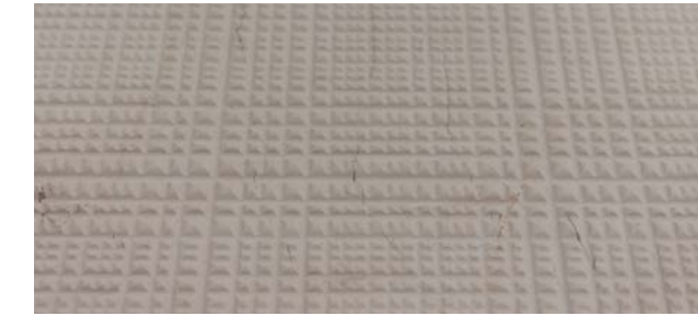
RIGATO DOUBLE BAMBOO