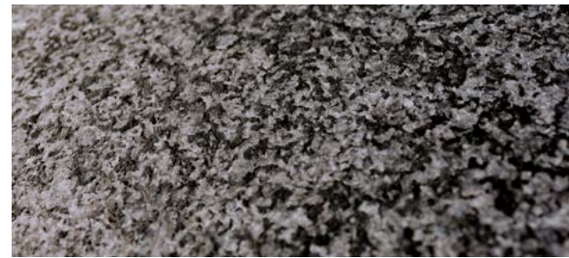
P.E.C. (SANDBLASTED/FLAMED* + WATERJET + HONED) *depending on the material