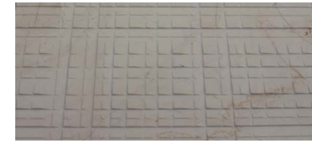
RIGATO DOUBLE DOLOMITE