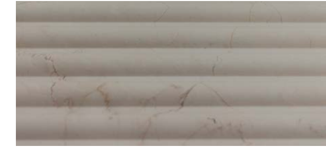
RIGATO TORELLO 20.5